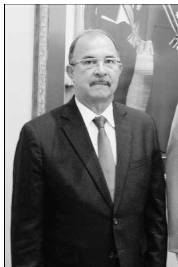
Gouverneur Fredis Refunjol van Aruba.

De gouverneur is in de eerste plaats en vooral plaatsvervanger van de koning en aldus constitutioneel hoofd van de landsregering. In die hoedanigheid heeft hij het recht om te worden geraadpleegd, te adviseren en te waarschuwen, maar meer ook niet; uiteindelijk zijn de opvattingen van de ministers leidend. Zij leggen rechtstreeks verantwoording af aan het democratisch gekozen parlement, de gouverneur niet. In staatsrechtelijke termen heet dit dat de gouverneur niet zelfstandig bevoegd is. Botter gezegd: de gouverneur moet altijd tekenen bij het kruisje, of hij dat nu