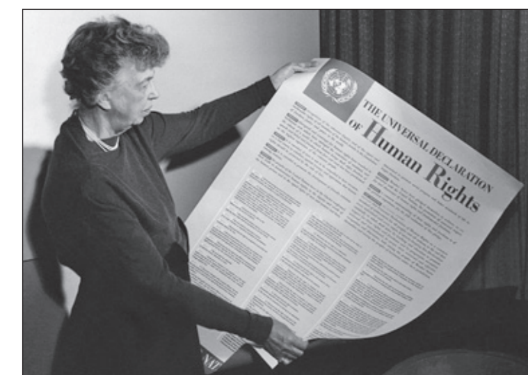
Eleanor Roosevelt met de Universele Verklaring van de Rechten van de Mens (UVRM) uit 1948. In 1966 heeft de Algemene Vergadering van de Verenigde Naties in haar Resolutie 2200 A (XXI) twee verdragen aangenomen die een versterking vormen van de UVRM. Hierin wordt ook het zelfbeschikkingsrecht opgenomen.