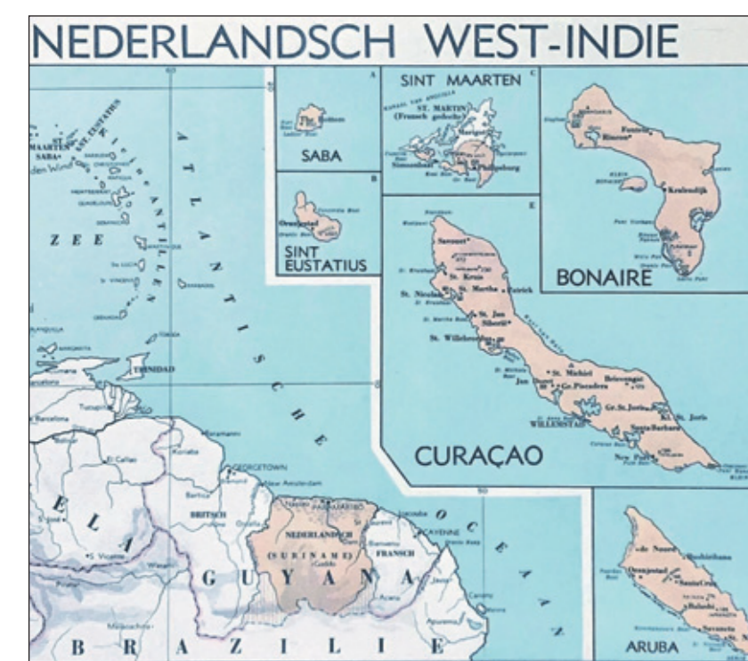
Een kaart van Nederlands West-Indië uit 1939, met daarop de Nederlandse Antillen en Suriname.