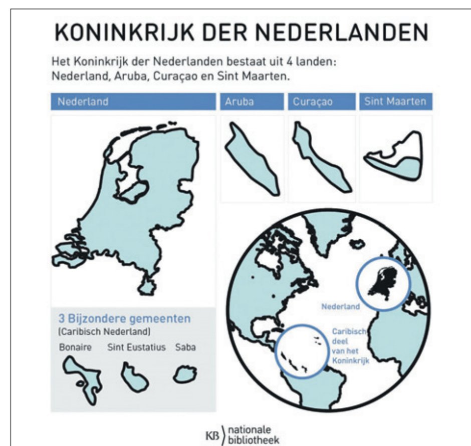
De nieuwe Staatkundige structuur sinds 10-10-2010.

De Algemene Vergadering heeft in de jaren na 1955 het zelfbeschikkingsrecht nader gedefinieerd en vastgelegd dat de uitoefening van het zelfbeschikkingsrecht kan leiden tot onafhankelijkheid, maar net zo goed kan worden verwezenlijkt via associatie of integratie met het voormalige moederland of een andere staat, of via 'any other status' . Met andere woorden: alles is goed zolang maar sprake is van een daad van vrije keuze van het volk. De Verenigde Naties hebben tevens uitgesproken dat voor het realiseren van de daad van vrije keuze het referendum het middel bij uitstek is. De opname van het zelfbeschikkingsrecht in de twee grote VN-Mensenrechtenverdragen van 1966 heeft de al bestaande gewoonterechtelijke betekenis van dat recht bevestigd.